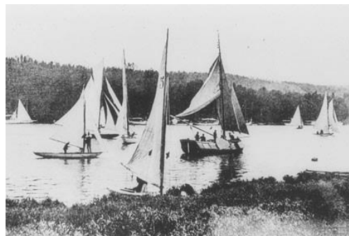
1920 : l'épreuve de voile sur le plan d'eau de Meulan